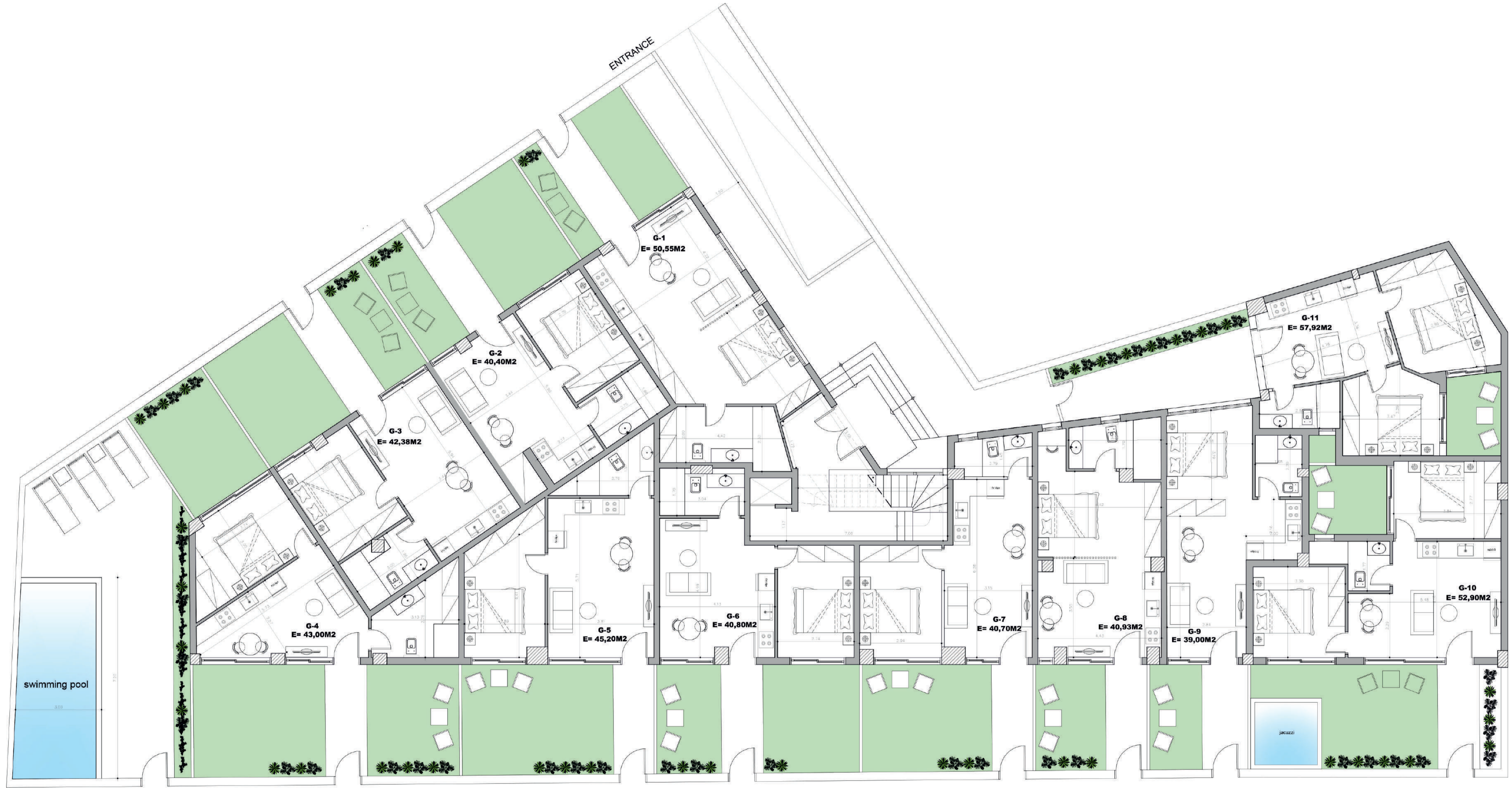
GROUND FLOOR - ZEMİN KAT