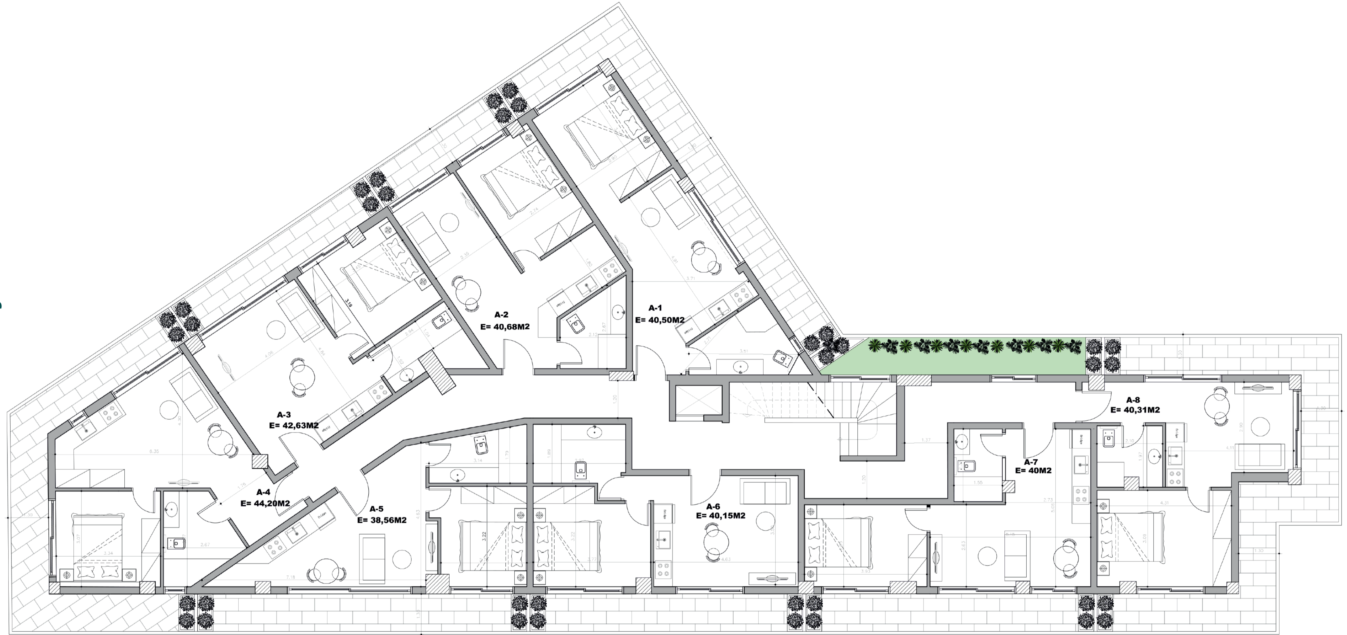
A FLOOR - A KATI - 2. KAT