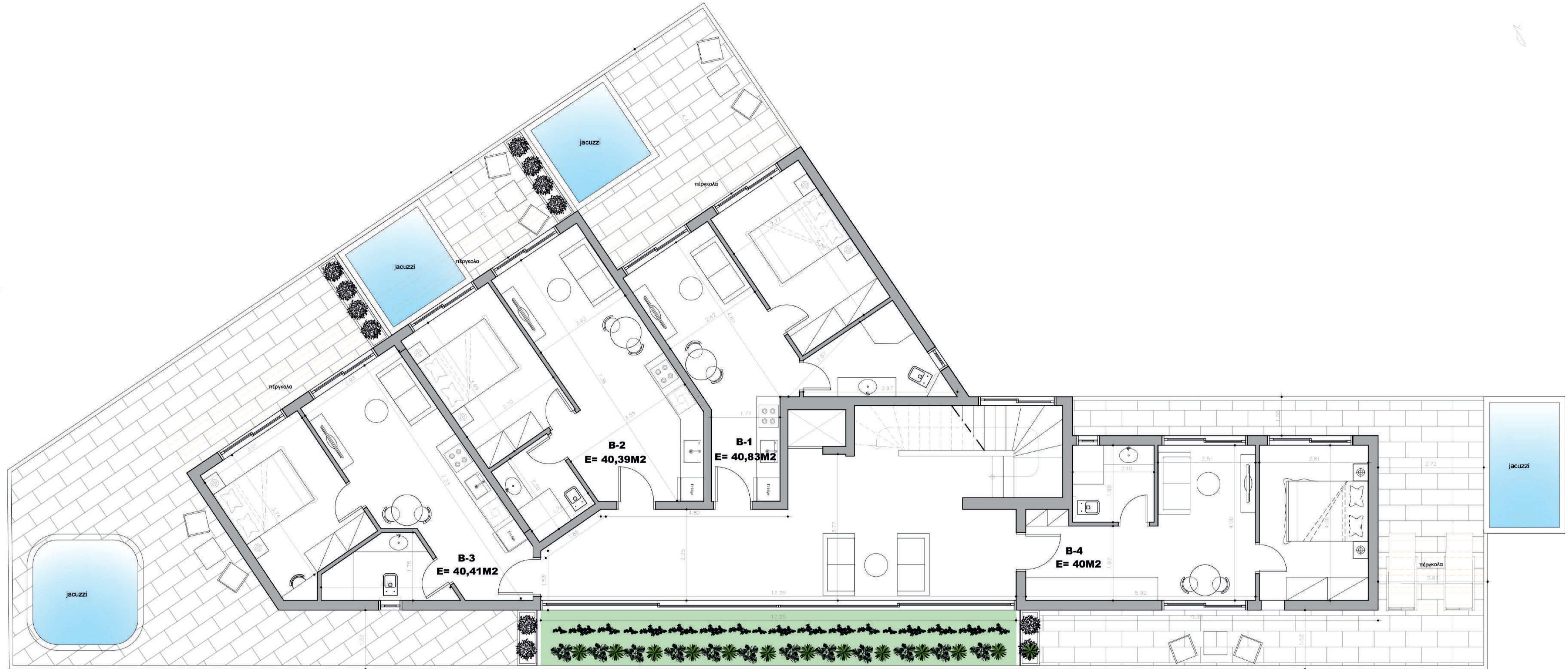
B FLOOR - B KATI - 3. KAT