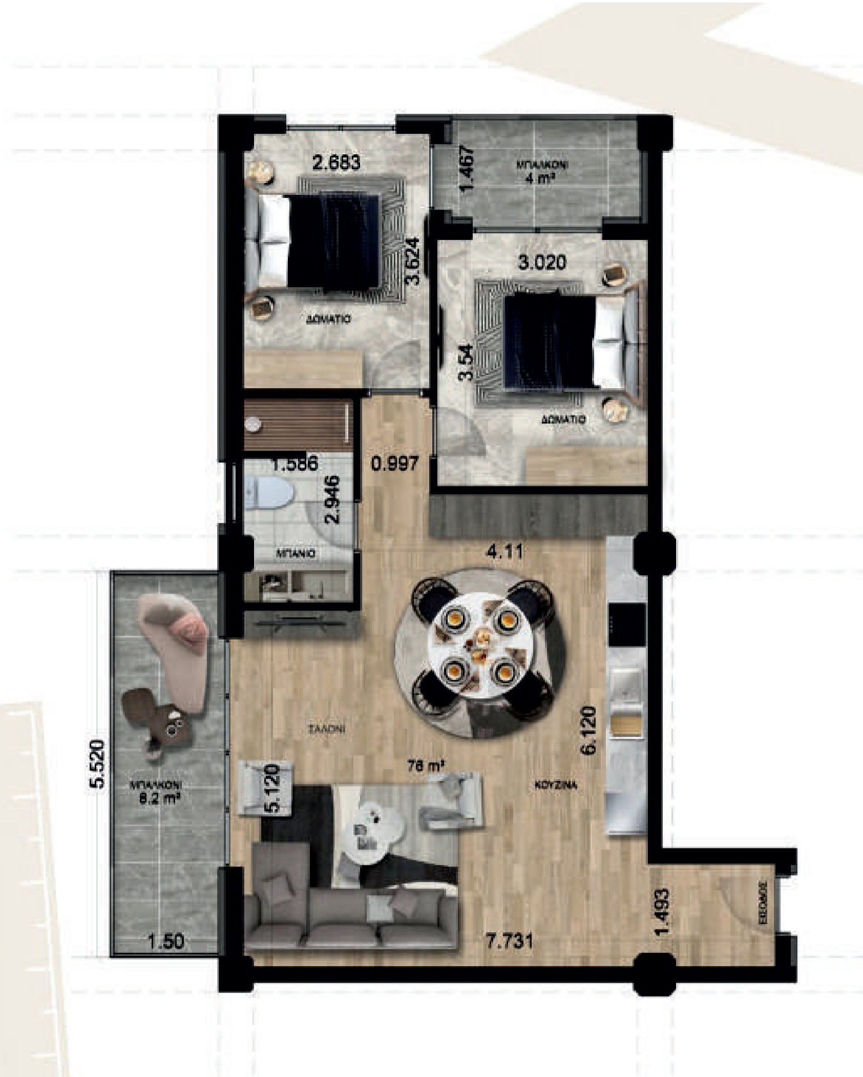
TYPE B D1.1 / D1.11 / D2.2 / D2.12 / D3.2 / D3.12 A TOTAL OF 6 APARTMENTS

1 Oda | 1 Banyo | Daire Başlangıç Fiyatı 132.500 €