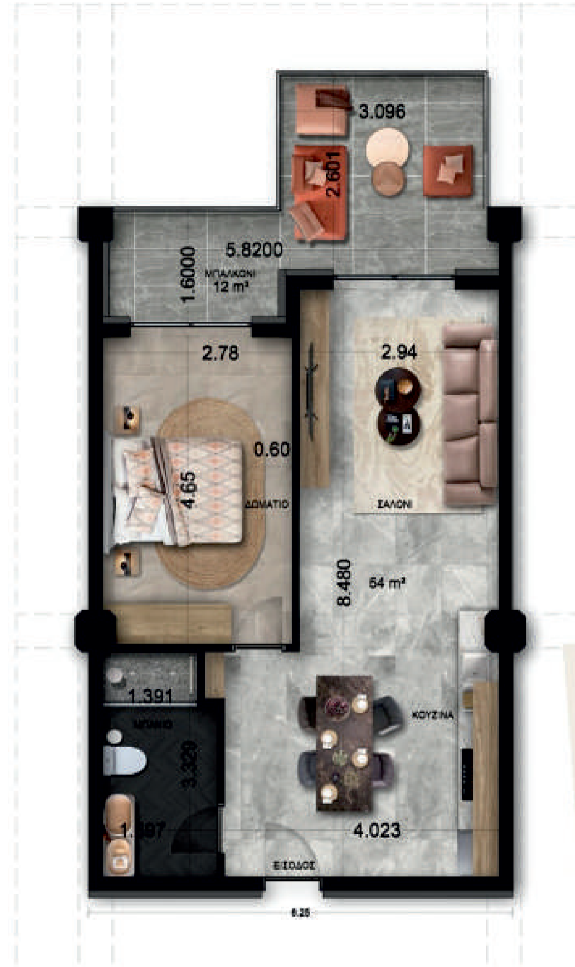
TYPE A D1.12 / D2.13 / D3.13 A TOTAL OF 3 APARTMENTS

1 Oda | 1 Banyo | Daire Başlangıç Fiyatı 132.500 €